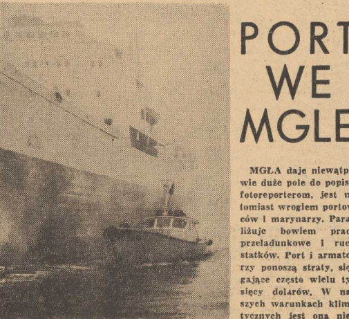
MAŁA „RENATA” wygląda przy dużym ślaku jak „mucha przy słoniu. Mimo sia jej widoczna jest pełna swa rolę łączniczki kapitanatu portu z jednostkami.

NA dnie basenu we wschodnim porcie Aleksandrii w Egipcie nurkowicze natknęli się na niezwykłe ważne znalezisko archeologiczne. Są to pozostałości słynnej, zbudowa nej 260 lat przed naszą erą, latarni morskiej, u chodzącej za jeden z ślad niku cudów świata starożytnego. Znaleziono pozosta łości mola Posejda, który był umieszczony na szczyście latarni, kilka ka miennych sfinków i kilka kolumn. (AW)