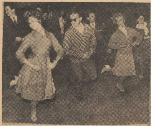
It's Madison Time!