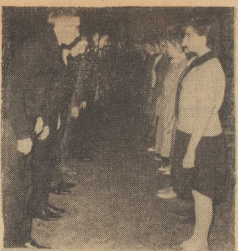
GŁOWY tancerzy chylą się w ukłon... (k)

Zasady nowego tańca są bardzo proste. Po wszechnie przyjęło się „It's Madison Time” (czyli — madisona czas zacząć!) jest zaproszeniem pod adresem wszystkich mających ochotę wesoło się zabawiać. Wychochymy na parkiet z własnej inicjatywy (a więc zgnaj „pietruśko wanie” parzeń pod ścianami!). Uczestnicy stają w rzędzie. Jedną z osób obejmuje prowadzenie i taniec się za-