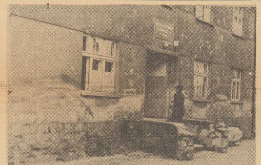
Na zdjęciu: salony widok Miejskiej Przychodni Rejonowej nr 10 w Dablu.

DZIŚ, o godz. 19 w Klubie MPiK „Ruch” z Teatru RWiA wzięli spektakl pt. „Dziś i jutro kosmonautyki”. Wstęp wolny. W NOWYM sezonie Woj. Domu Kultury — Zamek przystępuje do organizacji amatorskich zespołów teatralnych. Zainteresowanych mogą się zgłaszać do Działu Artystycznego codziennie w godz. od 10 do 20 w terminach: 10.10.75, 17.10.75, 24.10.75, telefonacja: 459-76. EKSPozytura Komisji Prawa Morza z Okręgu Szczecińskiego Zrzeszenia Prawników Polskich zawiadania, że 29 bm, o godz. 18.30 w Klubie MPiK „Ruch” zostanie wylosowany doczyt. dr. Władysława GORSKIEGO o charakterze na czas i przez wóz pasażerski.”