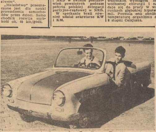
W DUNSKIEJ stoczni w Odense wodowano statek dla PLO o wyporności 14,5 tys. ton. Jednostka otrzymała nazwę — „Kraszewski”. Ta sama stocznia ma przystąpić do budowy drugiego frachtowca ino tonowego, tej samej wielkości dla PLO.

CZŁONKOWIE Charakowskiej Wojewódzkiej Technicznej Świetlicy Młodych Techników zbudowali mały dwucyfrowy samochódzik, który nazwali „Maleństwem”. „Maleństwo” przeznaczony jest dla nauki prowadzenia samochodów przez dzieci. Samo chodzik rozwija się z koszt ok. 60 km/godz.