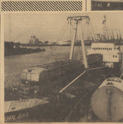
Podobać się mała, wygodna, a przede wszystkim bezpieczna, a przede wszystkim wygodna i bezpieczna.

WYBRALIŚMY te dwa szczególnie dramatyczne przykłady, aby