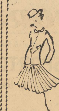
Modna sylwetka sezonu 62/63.

Nakazy te gorocznej mody (jeszcze — z mowej zmieniają zupełnie styl kobiety. Rozczochane podłokcie w kusej sukience ustąpił miejsca starannie ubranej kobiecie dojrzałej. Kolana są zdecydowanie zakryte, talia w swoim miejscu, lub raz wet nieco podwyższona, spodnie rozszerzone, jeśli nie plosowane, czy układane w plaskie kontrastaty — to cała obfitość materiału, wszystkie fałdy koncentrują się w przodu i tył zaś przetrwały „truch do przodu” jest charakterystycznym szczegółem nowej sylwetki, dotychczas bowiem rządziły posłyszane spodnie z falda. Najmodniejszymi kolorami są wszystkie toż od złotego poprzez ciemną czerwień do brązu, przy czym faworyzowanymi są kolor smoków, a nie brąz wjadający w czern. Po nadto modne są zbrązowiałe zielone, sliwkowe, niebiesko-szare, ciemnoszare, kolor sukni (jeśli chodzi o suknie wieczorowe), a także czerni oraz ciemne brzozy — tonacji brzozy bezowocnej.