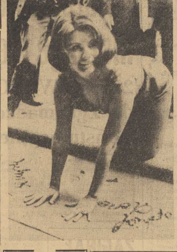
SOPHIA LOREN przejechała do Hollywood, by odebrać przyznanego jej w kwietniu "Oscara". Zgodnie z tradycją złożyła ona na betono- wej płycie przed Teatrem Chińskim Graumana odciśnięcie stóp i rąk, obok których wypisała swoje nazwisko.

Demo- bilizacja amerykańskich rezerwistów