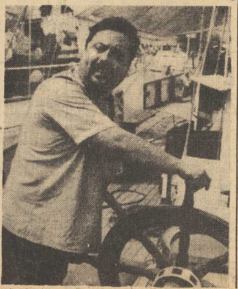
Bombard udaje się wraz z siedmioma lekarzami oraz 8 nurkami w okolice Sycylii, gdzie — przeprowadzając badania psychofizjologiczne — opłaniając po nurkowaniu. Jednocześnie dr Bombard jego pomocnicy plynac na jachcie „Captain Cap” zajma się problemem choroby morskiej. Na zdjęciu: dr Alain Bombard za sterem swojego statku.

NAZWISKO lekarza Alaina Bombarda jest znane wszystkim ludziom mającym coś wspólnego z morzem i zagadnieniami ratowniczymi. Dr Bombard od wielu lat przeprowadza badania nad zachowaniem się organizmu rozbitków oraz możliwości leczenia stanów chorobowych wynikających z pracy zawodowej nurków. Pod czas swojej szynnej wprawy na jachcie „La Coiffene” dr Bombard plynac samotnie, doświadczył, że spływając srurowa rybę można trzymać się przy życiu przez długi czas — 8 godzin. Prace dr Bombarda mają obywatelskie znaczenie dla współczesnego ratownictwa. W najbliższym czasie dr