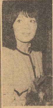
DO WARSZAWY przybyła na gościnne występy popularna piewniarka francuska J. Greco.