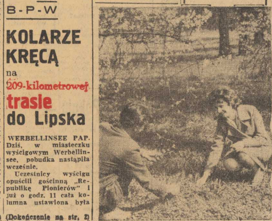
(Dokończenie na str. 2)