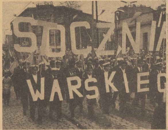
IDZIE chluba Szczecina — Załoga Stoczni Szczecińskiej.