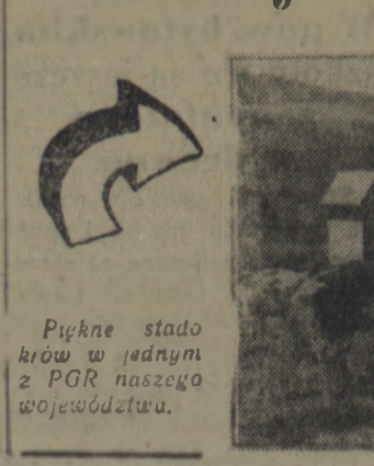
Piękne stado krów w jednym z PGR naszego województwa.