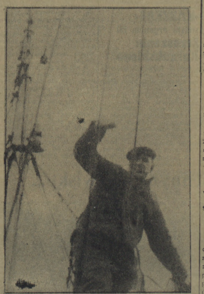
...rozpoczęły się na pokładzie i pod nim generalne porządki.

R UGIA jest wyspą kredową. Wszędzie bodaj pod powierzchnią od dwudziestu centymetrow do kilku metrów kreda, kreda, kreda. W Sassnitz jest kopalnia i oczyszczalnia kredy. Stąd zalewujemy bezpośrednio na za graniczne statki wędruje do państw skandynawskich, które z kolei, m. in. dostarczają kombinatowi różne gatunki szlachetnych ryb z Morza Północnego. Kombinaty nie mogą usilować się na brak ryby, a co ważniejsze, myśli się tu poważnie o dalszej rozbudowie fabryki konserw — tak, aby jak najwięcej tego produktu morza przerabiać na miejscu bez konieczności wysyłki do słab kraju, co tylko