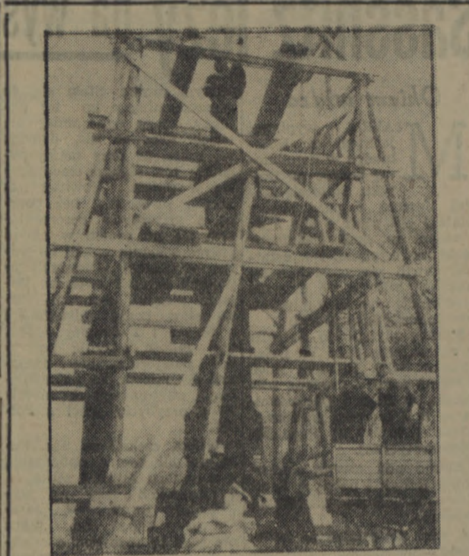
Pomnik Adama Mickiewicza, usunięty z placu Alma w Paryżu w związku z pracami porządkowymi, stanie obecnie na Cours-La-Reine.

A oto dla porównania kilka najbardziej charakterystycznych cyfr dla rozwoju przemysłu chemicznego w najbliższym 15-leciu. W r. 1970 będziemy produkowali 500 tys. ton siarki, a więc według wszelkiego prawdopodobieństwa niewiele więcej niż wynosi obecna produkcja Włoch. W dziedzinie produkcji siarki, która w tej chwili znajduje się u nas dopiero w powija-