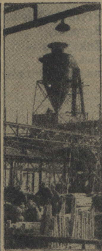
W Stupskiej Fabryce Mebli przystąpiono w tym roku do budowy nowej kotłowni. Roboty są już daleko zaawansowane. W obecnej chwili przygotowuje się części do montażu w gotowym już pomieszczeniu. Nowa kotłownia posiadać będzie urządzenie do automatycznego ładowania paliwa, usuwania smażki itp. Kotłownia zasili wiatną elektrownię, do starczy odpowiednia ilość pary potrzebna do produkcji i ogrzeje zakład. Nadmiar prądu z elektrowni popłynie do sieci miejskiej.