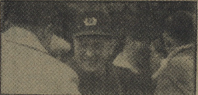
Ot, po prostu w chwili przycumowania weszli na kuter...

żart i później żalowałem tego. Ale tak to bywa, że Polak zawsze mądry po szkodzie. Po dość długiej odprawie celnej gdzieś koło 9 wieczorem wypłynęliśmy na Bałtyk, który zaczął się akurat bardziej niepokoić. Wiatr przybierał na sile, a łącznie z nim rosły fale i siła ich pędu zwiększała się z każdą chwilą. Nie wiem, co się dalej działo. Pamiętam tylko, że przez pokład przebiegała woda, a ja siedziałem za sterówką i moczyłem nogi. Poza tym prawie wszyscy jechali do tzw. rygi, co mi bardzo użyło, bo nie czulem się osamotniony.