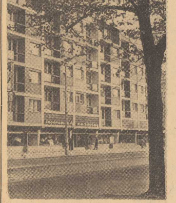
BARWNE elewacje nowych budynków podnoszą urodę Szczecina. NA ZDJĘCIU: blok mieszkalny przy Al. Niepodległości, z oddanym niedawno do użytku sklepami.