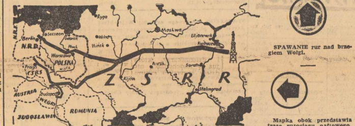
SPAWANIE rur nad brzo- giem Wólgi.