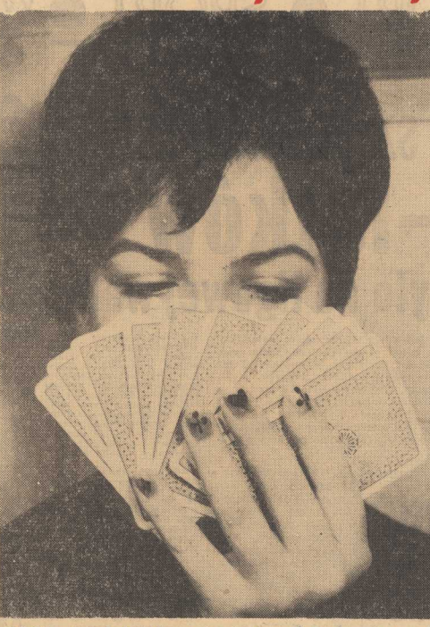
WŚROD młodych Duńek panuje ostatnio moda malowania paznokci...