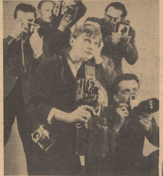
CAF — foto Wdowiński