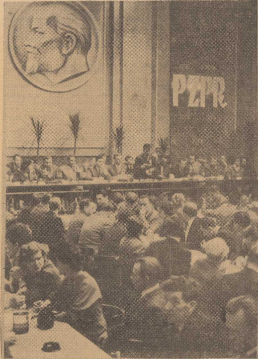
Sala obrad X Konferencji Miejskiej PZPR.