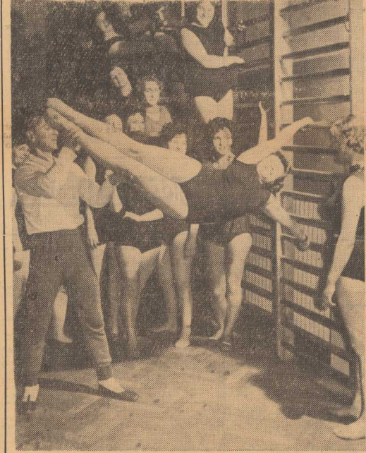
Przyjrzyjcie się Państwo tym zdjęciom. Panie, które sfotografował Stefan Ciesiak nie należą już do tej najmłodszej generacji, a przecież wszystkie mają zgrabne sylwetki i... uśmiechnięte twarze. To członkinie ogniska TKKF - „Linia”, które zrzesza amatorski gimnastyki i rytmiki. Takich ognisk, finansowanych przez Towarzystwo Krzewienia Kultury Fizycznej jest w województwie szesnastka. W ponad sto istniejących 35 ognisk, które otrzymują subwencje od zarządków pracy.

W ub. roku TKKF zorganizowało naukę pływania dla 300 osób. To tylko drobny wycinek działalności, projekcja jest także otwarcie kursów żużla, a może i szachów. Między w ogólnych TKKF jest dla wszystkich - niezależnie od wieku i płci. Cel stworzenia warunków dla osób