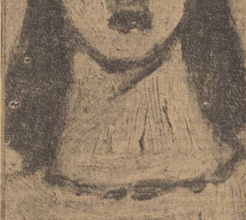
Korzystając z okazji wystawy w Radomiu, artysta ten otrzymał specjalną nagrodę...