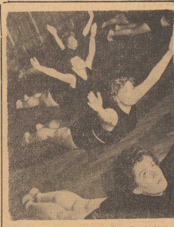
Przeciętna utrata wagi w ciągu 3 miesięcy - 4 kg. Duży sukces, ale i sporo trudu. Ale dla takiego celu warto „popłynąć” na parkiecie...

Wydawnictwo tych danych - biorąc pod uwagę ich pochodzenie - znajduje w cytelniku budzić w wątpliwości. Skonfrontujmy je więc z polskimi. Pierwsze z tej dziesiątki liczb przyniosło nam is ludność z 14.II.1946 wg. niego na Pomorzu było 478.954 Niemców. Skąd tak duża różnica? 500-800 tysięcy osób - jeśli brać pod uwagę dane wspomnianego