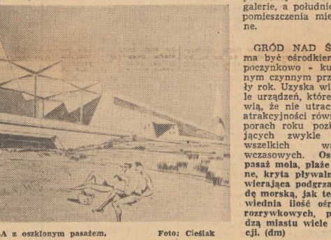
FRAGMENT MOLA z oszklonym pasażem.

WRESZCIE — PLAZA . Przebudowana i odpowiednio zagospodarowana, wyposażona zostanie w dwa ośrodki kąpielowe przeznaczone dla