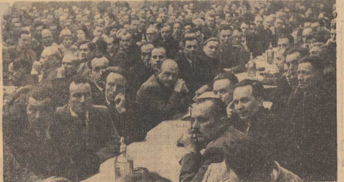
OGÓLNY WIDOK SALI PODCZAS OBRAĐ.