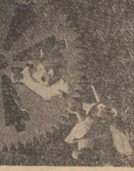
Przed premierą w „Pleciudze”