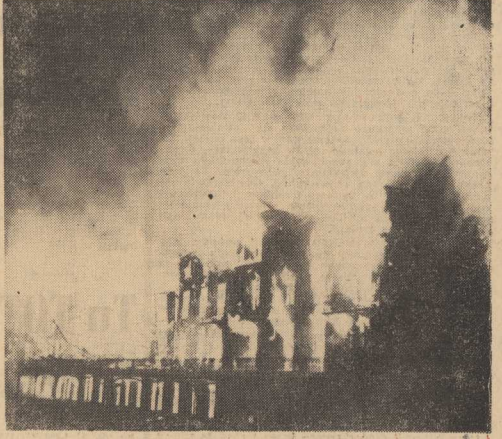
W SŁYNNNEJ szwajcarskiej miejscowości wypoczynkowej Rigi-Kalbita koło Lucerny wybuchł w nocy groźny pożar, w którego wyniku w „Grand Hotelu” (na zdjęciu, w płomieniach 11 osób straciło życie.