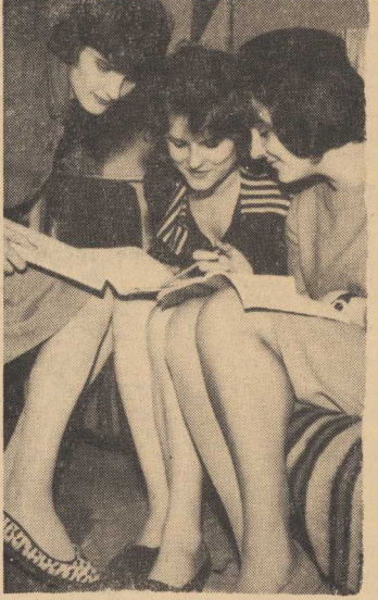
NA WYŻSZYCH UCZELNIACH trwa sesja egzaminacyjna. Zesłał to na zdjęciu Wszedobylskiencje fotoreportera CAF.

W EFEKCIĘ, prawie wszystkie domy, których budowę rozpoczęto się w bieżącym roku wzniesione zostaną tradycyjnymi metodami. PLAN Szczecińskiego Przedsiębiorstwa Budownictwa Miejskiego SPBM-2 nie przewiduje prac w okresie zimowym. I w tym przedsiębiorstwie przeważać będą tego roku budowy wykonywane sposobem tradycyjnym. Jeśli chodzi o zabezpieczenie frontu robót na okres zimowy to kierownictwo SPBM-2 nie przewiduje kłopotów, chyba że kazenie do użyciu do nastąpią przesunięcia końca roku ok. 3.800 limitów u inwestorów.