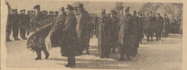
16 LAT temu i Gwardyjska Armia pod dowództwem marszałka A. A. Greczko, obecnego naczelnego dowódcy Zjednoczonych Sił Zbrojnych Państwa - Uczestników Układu Warszawskiego, wyzwoliła miasto Bielsko-Biala.

W rocznicę historycznego wyzwolenia miasta Greczko spotkał się ze społeczeństwem miasta. Podczas podniosłej uroczystości radzieckim marszałkowi przyznano tytuł honorowego obywatela Bielska-Białej oraz uroczono mu złotą odznakę „ZA SŁUŻBOM W ROZWOJU WOJEWÓDZTWA KATOWICKIEGO”. Na zdjęciu podczas pobytu w Bielsku-Białej marszałek A. A. Greczko odwiedził ulicę na cmentarzu żołnierzy radzieckich poległych w obronie miasta.