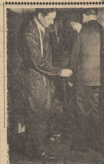
KRYTYCZNE spotkanie i „mistrz igły” de- cyduje: korekta spódnicy i poprawki na ramio- nach. Jutro odbiór gotowego ubrania i na światła zapewniony mąż... jak nowy.

Sięgnę tylko do kilku wyrywkowych przykła- dów. W hucie „Bierut” w Częstochowie aglom- rowania należąca do najbardziej zamiebanych od- działów. Przecież nie tylko uporzadkowano wszystkie składowiska i poszczególne stanowiska pracy — ale nawet postawiono... (w)