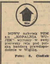
NOWY nabycie PZM s/s „KOPALNIA WUJEK” wyruszy w swój pierwszy rejs pod polską banderą prawdopodobnie w Wigilię.

Np. w październiku br. usline, trwające prawie 3 tygodnie sta-