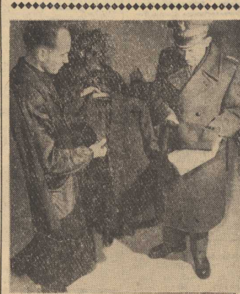
GARNITUR można kupić, można uszyć, a także wypożyczyć. Nowo powstała Wypożyczalnia Odzieży w sklepie „Artek” w Szczecinie oferuje ciemne ubrania i smoki w przystępnych cenach 100 zł za dobe.

nie system zlecenia. jest na szarym końcu. Doskonalem przykładem — szczybiński w- westorzy muszą zmie-