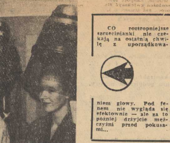
CO roztropniejsze szczecinianki nie exa- kują na ostatnią chwilę z uporządkowa- niem głowy. Pod fe- nem nie wygląda się efektownie — ale za- to później drżycie mę- żczyń przed pokusa- mi...

TRADYCJA — mila rzecz, jeśli nakazuje dbałość o wygląd i estetykę. Święta są o- kazją do masowego odświeżania tego „co na ciele i na głowie”. Krawcy i fryzjerzy mają ręce pełne ro- boty.