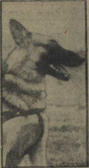
„Ikar” nieomylnie prowadził do złodziejskiej meliny.

Nie, nie mam wcale zamiaru pisać o mitologicznym lotniku Ikarze, który według podania greckiego wpadł do morza pod czas szybowania na skrzydłach.