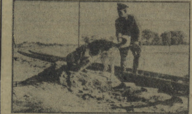
„Ikar” na tropie. Złodziej wraz z swym łupem przedei przez tory kolejowe.

Meldunek złożony w milicji Ptasiniski zastanawia się. Puścił w pogoń „Ikar” czy nie?... Puścił Pierwsza próba pogoń spaliła na panewce. Druga podobnie. Ptasiniski decyduje się na trzecią. Zdecydowany go- iop „Ikar” dowodzi, że jest „na śladzie”. Pół kilometra i... „Ikar” dranie pazurami w drzwi starej, stojącej na uboczu wsi, słodoły. Kółka widać lokalnie lup jest. A przestępca? „Ikar” truchtem podąży do grupy nie- czucz stojących kolo sklepu GS.