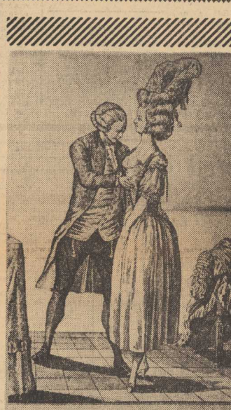
W pracowni damskiego krawca (I połowa XVIII wieku) ale niebroszowana. Czapki ich mogły być ozdobione jedynie kozimi skórkami i to na szerokości dwóch palców. Odpowic-

WIESŁAW RASZKOWSKI Szecina, Roosevelta 67/6