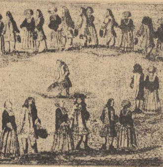
Stroje mieszczaństwa z XVII w.

dnie rozporządzenia przez strażę także przed noszeniem wszelkich ozdób złotego sukna i płótna, (Dokończenie na str. 4)