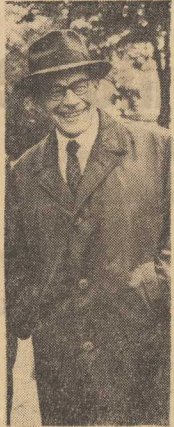
I sekretarz KC PZPR Wł. Gomułka