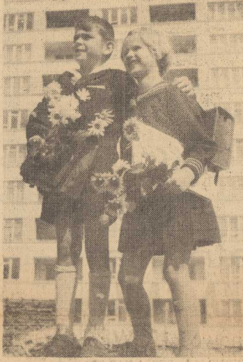
KWIATY DLA NASZEJ PANI