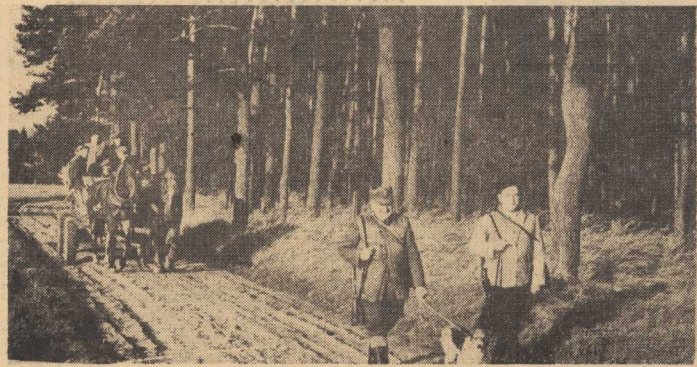
SEZON POLOWANIE. Fotoreporterzy CAF uczestniczyli w polowaniu (z kamerami) koła łowieckiego z Osirowa Wielkopolskiego. Pierwsze wyniki pozwalają przypuszczać, że w r. b. plon polowań będzie bogatszy niż w roku ubiegłym. Spółdzielnia „LAS” przewiduje skup ok. 1400 ton grubej zwierzyny, stanowiącej poszukiwany artykuł na rynkach zagranicznych, platny od 600 do 800 dolarów za tonę.

TELEFON Z GŁOSNIKIEM NIE ZAWSZE jest wygodnie trzymać przy uchu się chwytka telefoniczna. Nie można np. pić z kawy, nie ma się jednej ręki zajęta, przysposobienie głosnika do słuchania rozmowy telefonicznej przez wszystkich obywateli zmagających się w całym państwie. Jeden z wielkich koncernów elektrotechnicznych wypuścił na rynek wzmocniacz transformatorowy do zwykłych miejskich aparatów telefonicznych. Nie trzeba go włączać ani do sieci elektrycznej, ani przyłączać do telefonu. Wystarczy postawić go na stole, a obok niego, nie dając się w ogóle wstrząsnąć kilkoma centymetrami, połączy przewód od telefonizacji słuchawki i rękawiczkę odpowiedni przełącznik. (w)