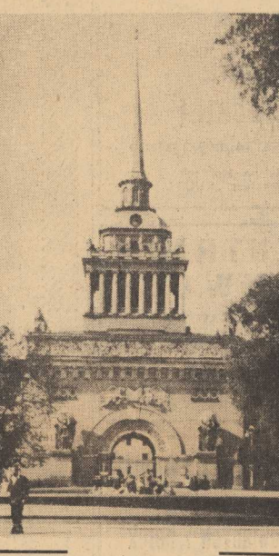
CENTRUM architektoniczne Leningradu — Pałac Admiralicji.

Zaczęła się przyjacielska i serdeczna rozmowa. Przypadkiem zaprowadził mnie do mieszkania starożytnego doświadczonego działacza bolszewickiego, który obecnie będnąc na rencie partyjnej, aktywnie uczestniczy w życiu społecznym swojej dzielnicy.