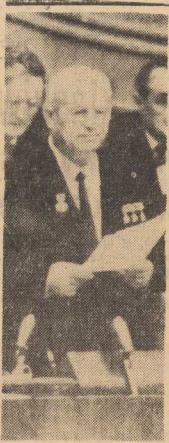
N. Chruszczow na trybunie XXII ZJAZDU KOMUNISTYCZNEJ PARTII ZWIĄZKU RADZIECKIEGO.

◆ Kto da więcej? ◆ TAJEMNICE zagubionych WALIZEK — poznasz na str. 6