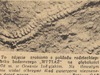
To zdjęcie zrobiono z pokładu radzieckiego statku badawczego „WITIAZ” na ołobokost 2970 m. w Oceanie Indyjskim. Na lotowym dnie widać obrzyni ślad zwierzęcia nieznanego rodzaju naucz.