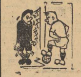
WYBONUWACZA BRAMKARZ zdobył dla Pogoni 1:0, grając w szczecińskim stadionie, a w...

Już w 5 min. portowcy mieli kapitalną sytuację do zdobycia bramki, kiedy to obrona sparował ostry strzał Krzyżostolika i piłka odbiła się od słupka. Kiedy jednak nie zdążył do niej dobiec i uprzedził go bramkarz gospodarzy. Nie przed zdołał prowadzenie w 25 min. w dość przypadkowej sytuacji. Leszczyński podawał piłkę do Mendalki, lecz utknęła ona w portawce przed bramką. Mendalko spóźnił się z interwencją co wykorzystał bramkarz gospodarzy lokując piłkę w siatce.