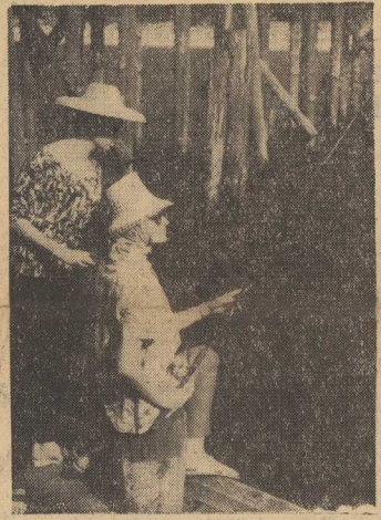
CO, ALBO MOŻE KTO — POLKNIJE TEN HACZYK?

Prasa tunijska wyraża na- wierzające oburzenie z po- wodu akcji Francuzów, którzy — jak stwierdza korespondent „As-Sabah“ — wy- korzystując bezczelność a- gresji w Bizercie, rozsze- rzyli strefę działań wo- jennych.