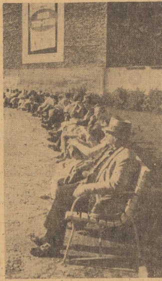
Kiedy zabłysną neony nad Odrą?