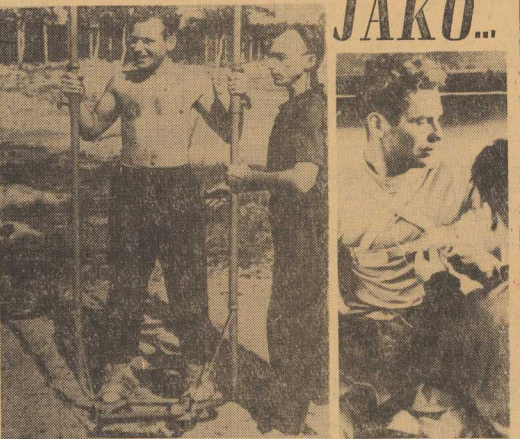
„fotomator” „sportowice” „Kosmonauta przed lotem”