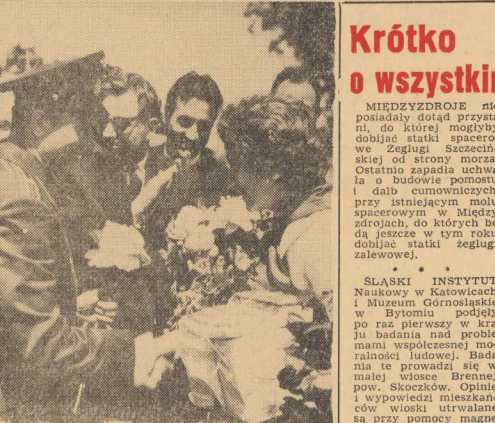
ŁUDNOŚĆ BULGARII wzięta Jurija GAGARINA chlebem i solą.