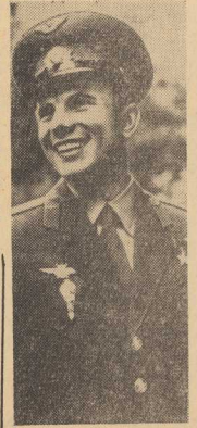
MAJOR GAGARIN za bawi w Polsce 3 dni. Dziś ok. godziny 17 wieża na Starej i Nowej Miasie, a następnie oblaty m.in. wystawę pt. „Pierwszy człowiek w Kosmosie”.

Zwirki i Wigury, Raszynską, Filtrów, Krzywickiego, Nowowiejską do pl. Zbawiciela, następnie Al. Wyzwolenia, odcińkami Al. Dzieduszycki, ul. Krasińskich, odcińkami ul. Belwederskiej.