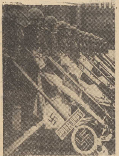
A TAK się skończyło. Oto składanie sztandaru hitlerowskich u stóp Mauzoleum Lenina.

Na spotkaniu z wyższymi oficerami Wehrmachtu w grudniu 1940 r. z okazji zakończenia prac nad planem Barbarossa — planem napadu na Związek Radziecki — Hitler powiedział: „Nie popełnię błędów Napoleona. Kiedy wyruszę na Moskwę uczynię to dosyć weześnie, aby osiągnąć ją przed zimą”. Führer nie dotrzymał słowa. Dokładnie 20 lat temu, 22 czerwca armie hitlerowskie przekroczyły granicę radziecką na Bugu. Pancerne watahy Wehrmachtu i niezliczone eskadry Luftwaffe wdarły się głęboko w głąb Białorusi i Ukrainy, pozostawiając za sobą bezprzykładne zniszczenia.