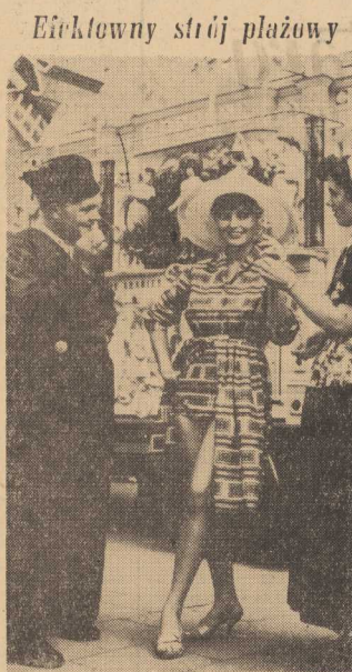
NA TLE wiatrak i słynnej katarzynki - gigant z Groningen piękna Holenderka w otoczeniu rybaków w tradycyjnych strojach prezentuje model sukni plażowej. Całość składa się z kostiumu plażowego z kretonu w kolorze „szary” i sukni marszczonoj w talii spódnicy zapletnej na dwa guziki. Błuska lekko wyznaczona z materiału kolbieryckiego i keszulowym 3/4 rękawem. Na zakolrzeżeniu słomkowy kapelusik i piękne złote sandały na wysokim obcasie.

niebaldam był więc swego rodzaju daniem do totalnego opozerstwa.