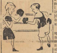
(Dokończenie ze str. 1)

SCHODNIO do lodowca, Montreal. Po satanku- waniu zaczynamy wiat i etap powrotny podróży. Wzrost w samolocie przy- gaszona wiata. Nawet ko- łażność ucinają sobie drze- 23 lata bez wypadku w powietrzu. „Boeing” daje w zasadzie 100 proc. bezpieczeństwa, nawet jeśli 2 z 4 moto- rów odmówią posłuszeń- stwa”.