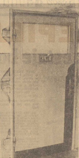
Drzwi można wyjmować ze ścian z futrynam.

W tym celu w Warszawie stolecznych Wydział Opieki Społecznej wraz z Milicją przystąpił do skontrolowania osób trudniących się zehranian. W większości wy padków okazali się pseudo-