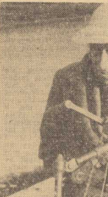
„Telimena” w stroju plażowym... Pierwsze młode ziemniaki pokaza się na rynku...