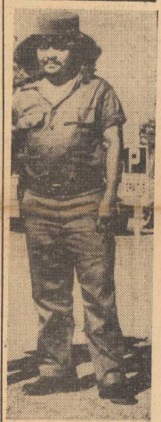
TEN oto długowłosy kibiczyk „PELUDO” jest charakterystycznym przedstawicielem ludowej armii Fidela Castro.

JAK wynika ze sprawozdań M.DBOR, przedsiębiorstwa podległe Szczęcińskiemu Zarządowi Budownictwa za 4 mile słonec hr. wykonały finansowy plan roczny budownictwa mieszkaniowego Rady Narodowej w Szczecinie w wysokości 12,7 proc. Tymczasem w tym okresie czasu powinny być wykonane co najmniej ca 25 proc. GŁÓWNA przyczyną takiego stanu rzeczy jest m. in. słaby postęp robót na jednym z największych placów budów Szczecina — Osiedlu Grunwaldzkim. OSIEDLE Grunwaldzkie jest budową będącą dużym osiągnięciem myśli technicznej osiedla szczęcińskiego. Zastosowana tu metoda budowy pozwala wybudować budynek 5 kondygnacyjny w ca 7 miesięcy. Powinno natomiast być wybudowane takiego obiektu w tym czasie, który jest to skrócenie tego cyklu o połowę. (Dokończ na str. 2)