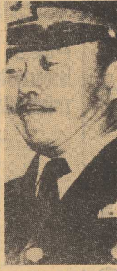
GENERAL CZANG DO JUNG stoi na czele „Rewolucyjnego komitetu wojskowego”, który ku zadowoleniu Amerykanów dokonał zamachu stanu i przejął władzę w Korei Południowej.