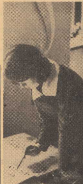
ABITURENTKA Liceum Sztuk Plastycznych odzwierciedla na bryle matURALną kompozycję afisza sportowego.