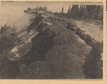
UPARTE MORZE METR PO METRZE POZERA BRZEG.

(Dane zaczerpnięte z ankiety przeprowadzonej przez Zakład Pracy Współczesnej U. W.)