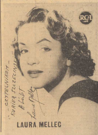
„CZYTELNIKOWI” KURIER SZCZECIŃSKI

NOWY JORK (PAP). Zmarł na całym świecie aktor filmowy Gary Cooper zmarł w sobotę w Hollywood w wieku lat 60. Był on już od pewnego czasu chory na raka, a od kwietnia br. stan jego był beznadziejny.