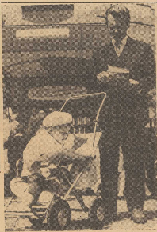
OCIĘC I SYN z zainteresowaniem przeglądają do piątego egzemplarza książki na tradycyjnym kiermaszu.

NERWOWE i niecierpliwie zachowanie się jednych z młodych podróźników na dworcu w B. turbidowało zainteresowaną dykturującego milicjanta. Podszedł i zapytał o bilet. Nie miała. Poprosił ją zatem do komisarzatu dworcowego. Tu kobieta nie wytrzymała nerwowo i uczyniła go straszliwie wyszczelniał. „Przyjechałam do B., bo w Szczecinie zamordowali mnie nieustannie...”