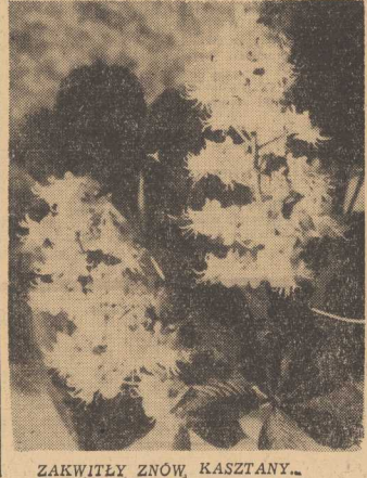
ZAKWITŁY ŻNÓW, KASZTANY...