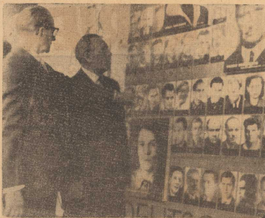
ZGINELI W OBOZIE ŚMIERCI SACHSENHAUSEN

NA TERENIE b. obow. koncentracyjnego w Sachsenhausen pod Berlinem odbyło się uroczyste przekazanie spoczęstwu NRD Mauzoleum wzniesionemu dla uczczenia ofiar faszystowskiego terroru. Na zdjęciu: fragment wystawy w muzeum obozowym z zdjęciami pomordowanych w Sachsenhausen więźniów.