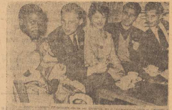
Student fra Ost og Vest holder top-møde

Po ukończeniu seminarium Polacy spędzi 4 dni w mieście uniwersyteckim Aarhus, a następnie 5 dni w Kopenhadze.