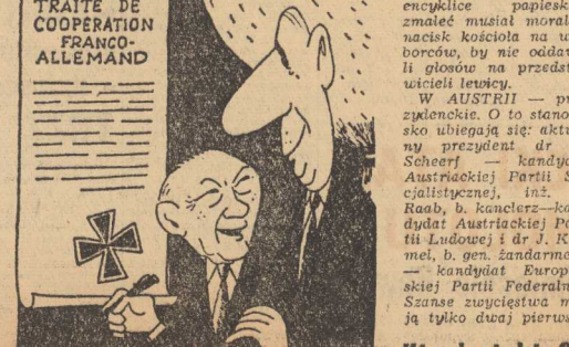
Ja podpisuję się krzyżykiem...

W WŁOSZECH - parlamentarne. Obserwatorzy oczekują straty głosów przez centrum i prawicę, wiążąc to z tym, iż po ostatniej encyklice papieżkiej zmalał musiał moralny nacisk kościoła na wyborców, by nie oddawała li głosów na przedstawicieli lewicy.