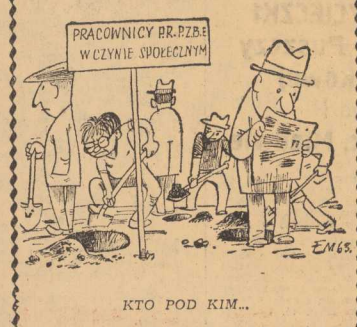
KTO POD KIM...