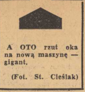
A OTO rzut oka na nową maszynę — gigant.

DO zszywania operowanych tkanek chirurgzy węgierscy używają ostatnio kłamek z syn tetycznego materiału zwanego bioplastykiem. Po pewnym czasie kłamek te rozpuszczają się i są wchłaniane przez organizm. (WIK)