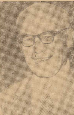
Władysław Gomułka, premier Polski Ludowej