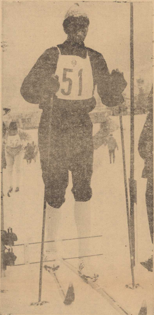
NORWEG GROENNINGEN jest głównym faworytem w biegu na 15 i 30 km podczas Olimpiady Zimowej w Innsbrucku.