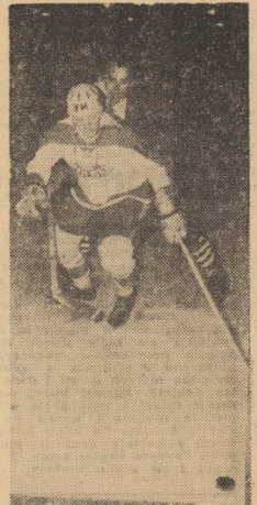
A OTO fragment piątkowego meczu Polska — Finlandia B, rozegranego na „Lodogryfie”.