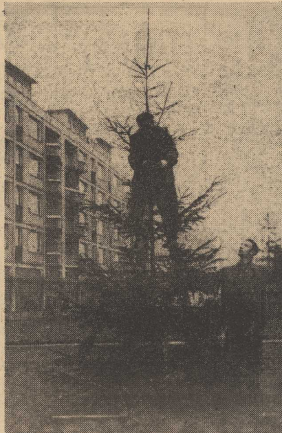
NA ZDJĘCIU: zakładanie "świetlnych łańcuchów" na chodniku ustawione przy ul. Jaromira.