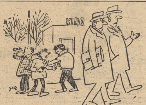
— Czy zauważył pan, jak teraz dzieci szybko dojrzewają? Rys. K. Ferster („Prawo i Życie“)

W NIEKOTRYCH sytuacjach, np. w czasie katastrof — jedynie na podstawie odcisków palców możliwe jest zidentyfikowanie tożsamości człowieka. Stąd też metoda ta poza milicją znajduje coraz szersze zastosowanie. W tym też celu w Zakładzie Kryminalistyki Komendy Głównej MO opracowany został bezbarwny i niebrudzący płyn, który na odpowiednim papierze daje... czarne odciski linii papilarnych, a palce pozostają nadal czyste. (BN-T PAP).