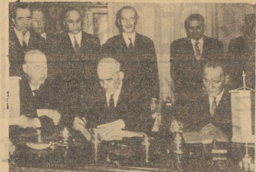
Na zdjęciu: Janos Kadar, Władysław Gomułka i Józef Cyrankiewicz podpisują wspólne oświadczenie.

żyć będą dobrze zarówno interesom Polski i Węgier, jak i wspólnej sprawie pokoju i socjalizmu.