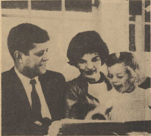
Prezydent Kennedy, pani Jacqueline Kennedy i ich córka Karolina.