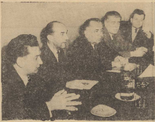
DELEGACJA WĘGIERSKA w czasie rozmów z kierownictwem szczecińskiego „Hartwiga“.

„Kurier“ rozmawia z zastępcą dyrektora „Maspedu“ F. Glöcklerem