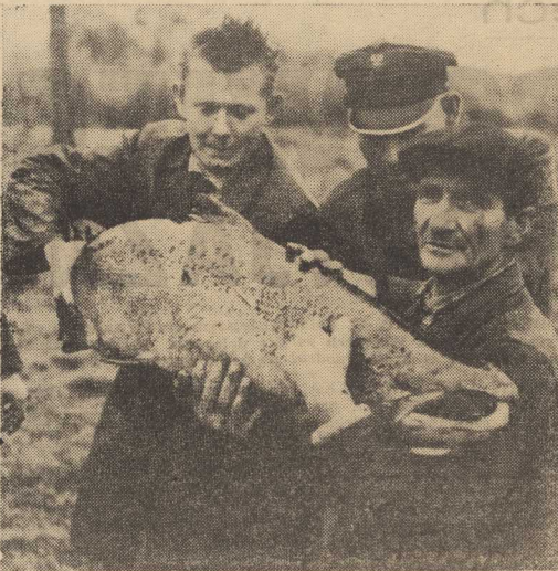
W RZEKACH województwa koszalińskiego trwają odłowy łosia dla celów hodowlanych. Ostatnio w pulapkę na rzecze Grabowej wpadł duży okaz wagi 20 kg.