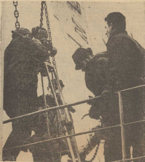
EKIPA RZYSZERA DZIEDZINY, REALIZUJĄCA W SZCZECINIE FILM PT. „RACHUNEK SUMIENIA”, OSNU TY NA KAWIE POWIĘSI R. LISKOWACKIEGO, WY KORZYSTAŁA WODOWANIE MJS „KOMER” DLA NAKRE CENIA PRZEWIDZIANEGO W SCENARIUSZU FRAGMENTU AKCJI, ROZGRYWAJĄCEJ SIĘ W STOCZNI SZCZECIN SKIEJ IM. A. WARSKIEGO.

OD wielu już lat statki rybackie wyruszają za burtę setki ton ryb niewymiarowych, łowionych przy okazji połowów przemysłowych. Od wielu lat nie wykorzystują się tego surowca. Niestety, od pokładu do fabryki maczki rybniej droga jest bardzo długa. Chociaż wielu działaczy gospodarczych dostrzegało konieczność zmiany tej sytuacji, podjęcie konkretnych działań nie było łatwe.