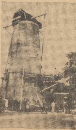
STARY wiatrak holenderski w Maasluis k Rotterdamu, zbudowany w 1620 r., utracił skrzydła wskutek pęknięcia osi. Szczęśliwie w chwili wypadku nikogo w pobliżu nie było.

ROK ZAŁOŻENIA — 1948 WYD. AB Cena 50 gr. Nr 224 (5940) WTOREK, 24. IX. 63 r.