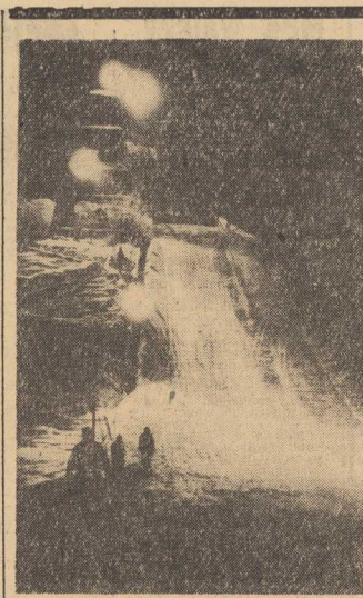
MROŻNA zima i śnieg stwarzają idealne warunki dla uprawiania sportów zimowych...