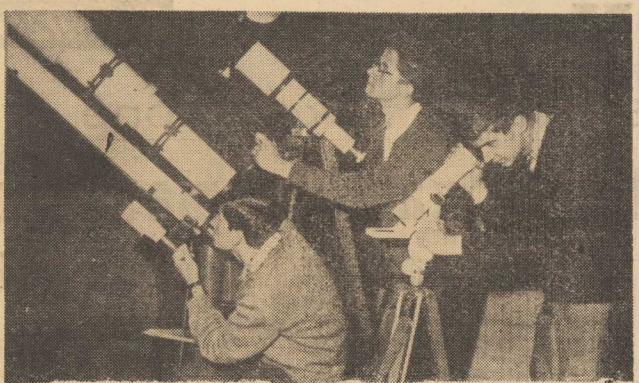
PO OSTATNICH RAZDZIEKICH EKSPERYMENTACH KOSMICZNYCH — GRUPOWYM LOCIE „WOSTOKA-5” I „WOSTOKA-6”;

ROK ZAŁOŻENIA — 1945 Cena 50 gr WYD. AB Nr 144 (5869) PIĄTEK, 21. VI. 63 r. SOBOTA, 22. VI. 63 r.