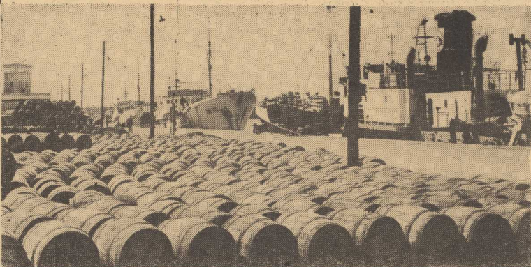
NA NABRZEŻU świnoujściejskiej „Odry”, jak zwykle sezonowy ruch. Seki bezceksy przywiezione przez jednostki łowcze z rozmaitych akwenów, oczekują na transport do zakładów przetwórczych i chłodni. (W)

W Chelmku z kolei rusza w przyszłym roku produkcja sztućcejskiej skóry. Pierwsza partia towaru ukaże się w IV kwartale.