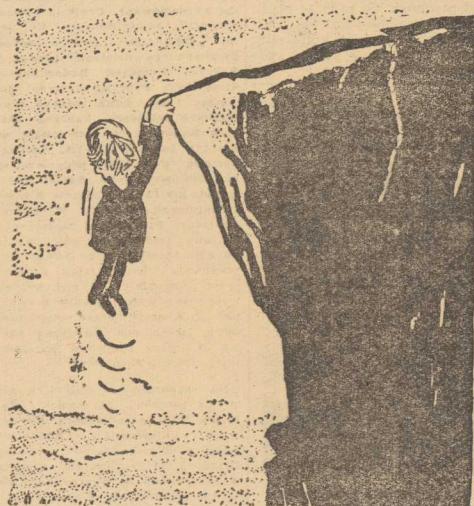
MACMILLAN: Pragnę utrzymać się jak najdłużej... (ker)