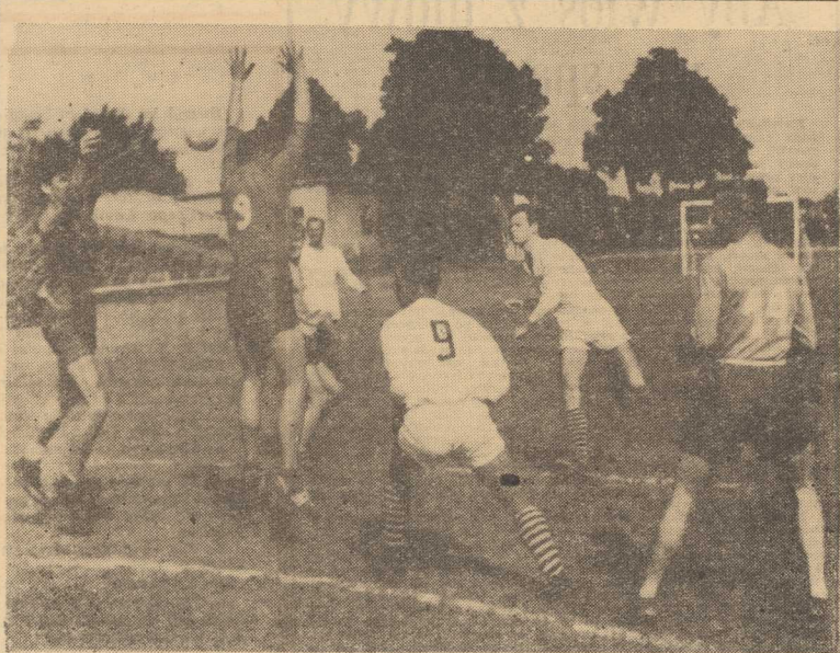
W SZCZECINIE odbywają się mistrzostwa Pomorskiego Okręgu Wojskowego w piłce ręcznej. Na zdjęciu: fragment jednego ze spotkań.

SUMA posiadanych punktów przemawia na korzyść Unii, jednak minimalne podknięcie w jednym z dwóch ostatnich meczów może tę przewagę zredukować do zera. Wówczas — przy jednoczesnych zwycięstwach Rakowa — obaj rywale posiadaliby na finiszu jednakową ilość punktów. O awansie decydowałaby więc różnica bramek. Obecny układ sił pierwszej trójki jest następujący: